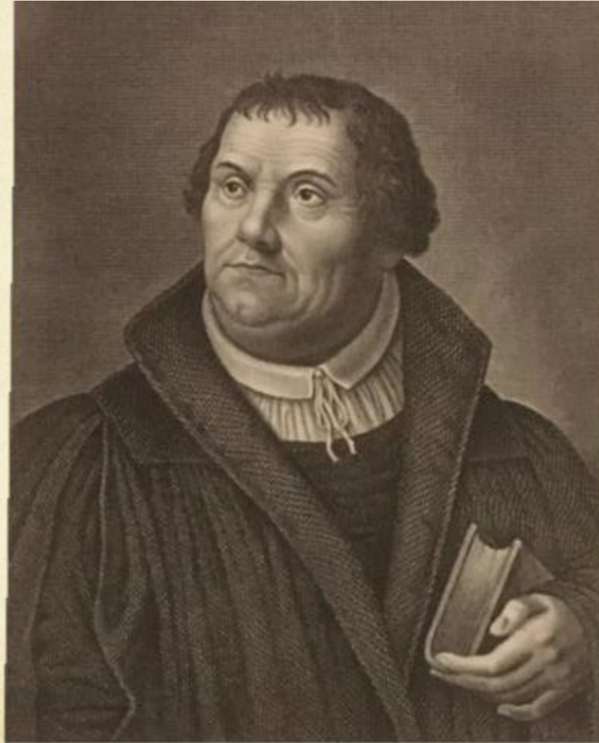
Stahlstich von F. Nordheim